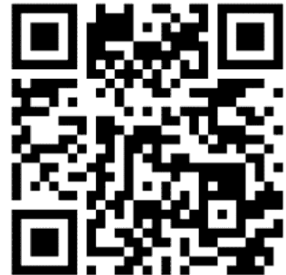
課程與教學計畫填報系統