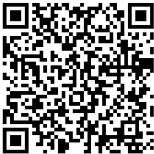
攜手桃花源 Youtube 頻道