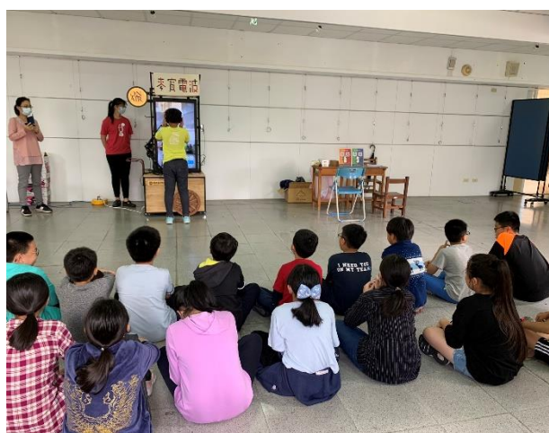
麥寶電波體驗活動紀實 1