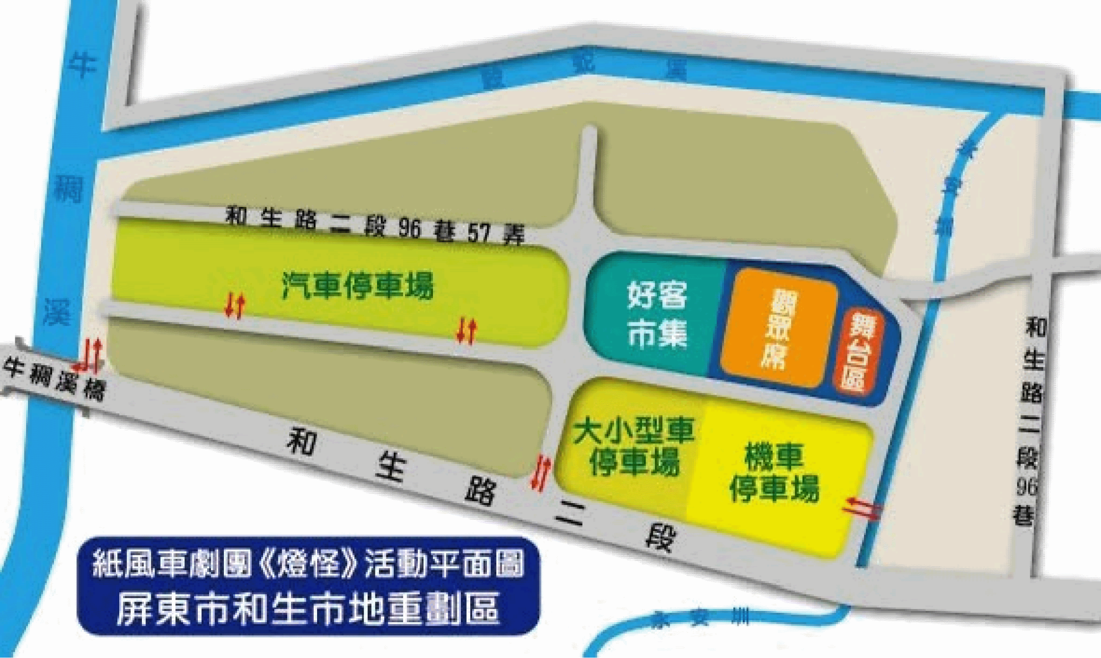
紙風車劇團《燈怪》活動平面圖 屏東市和生市地重劃區